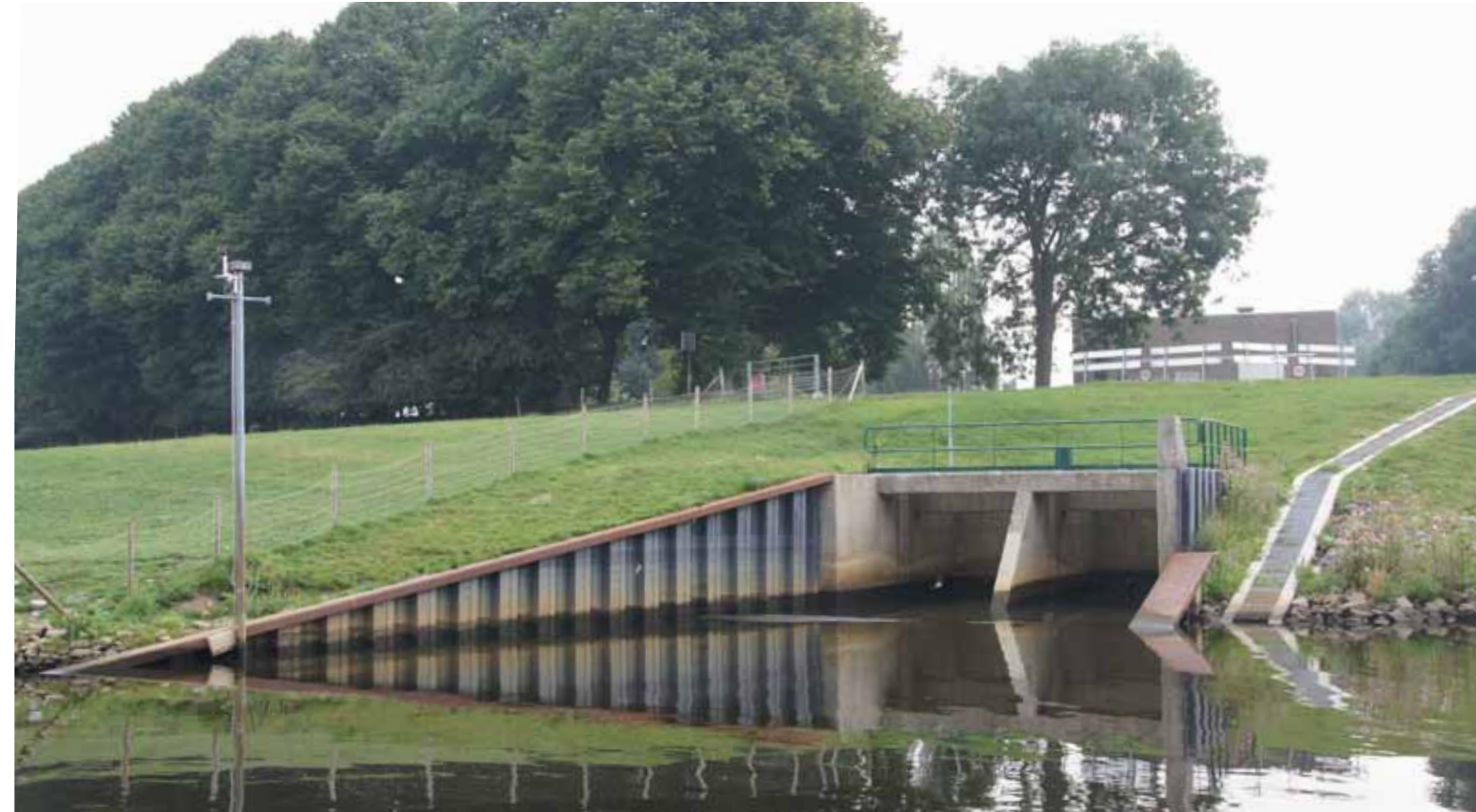
gemaal Gansoyen Balkon aan de Maas Waalwijk